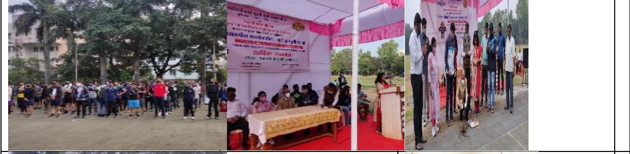
Fit India Program